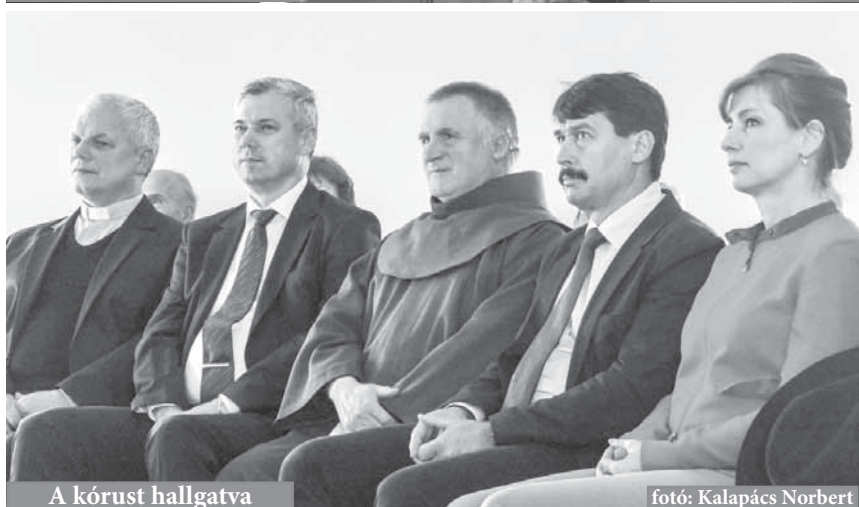
A kórust hallgatva