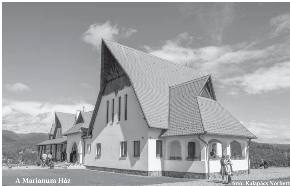
A Marianum Ház