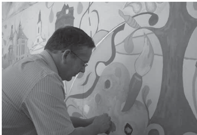
Michl József, Tata város polgármestere