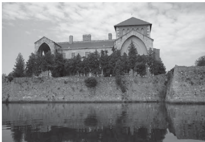
A tatai vár látképe az Öreg-tóról

Mindez egy megválaszolatlan levél újra olvasása kapcsán jut az eszembe. Örömmel és büntudattal olvasom. Örömmel, mert jó hírt hoz, a büntudat meg azért van, mert a kapott levelek tömkelegében – kíván-