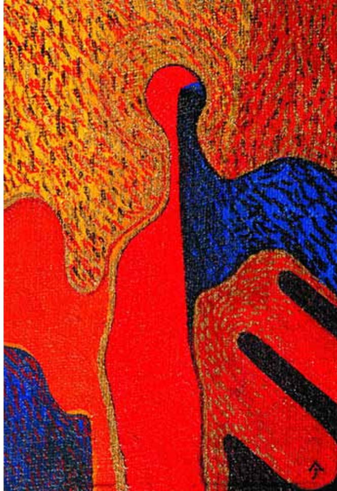
Aknay János: Angyal ikon

naptár fordul fagy csikordul eresz alatt csepp lecsordul itt az idő - hol az idő tavaszváró új esztendő!