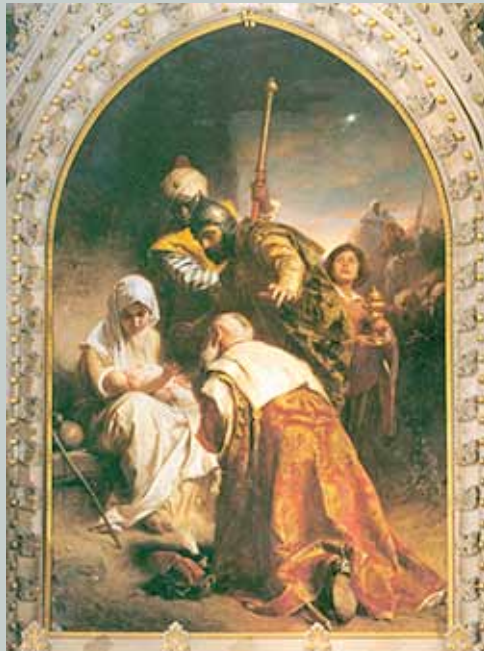
Benczúr Gyula: Napkeleti bölcsek

2. Ugyancsak János apostol, evangéliumának 3. fejezetében írja le, hogy egy előkelő tanácsos, Nikodémus éjszaka kereste fel Jézust. Nikodémus és minden kereső, gondokkal küzdő számára, Jézus Krisztus az a valaki lett, akit bármikor és bármivel fel lehet keresni. Nála nincs alkalmatlan idő, alkalmatlankodó ember. De még csak megoldhatatlan probléma sincs, mert Ő a beteg lelkek isteni orvosa. És mennyi be-