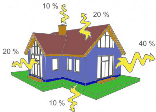
Hővesztesség hőszigetelés nélkül